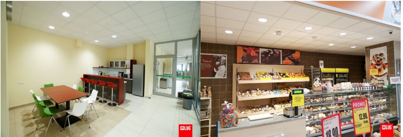
LUG LED Competence Center, Nowy Kisielin, Polska